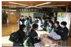
R3 サツマイモ募金の様子

5月6日(金)の帰りの会終了後に令和4年度のJRC加盟登録式が各学級で行われました。この日は、全校生徒がJRCの一員としての「誓い」の言葉を述べました。これまで本校では、毎年JRC委員会を中心に様々な活動に取り組んできました。今年度も「助け合い」を合い言葉に、福祉の心を育んでいきたいと思えます。